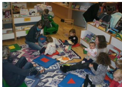
Médiathèque de VLH le 21/11

Si ce n'est pas déjà fait, n'hésitez pas à vous inscrire auprès de notre service.