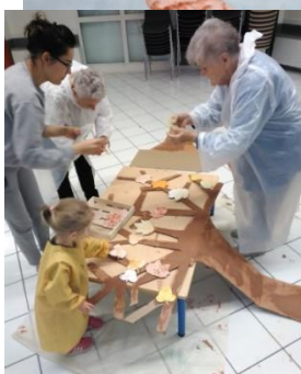
L'automne avec l'association « trait d'union »